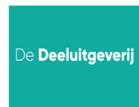
De Deeluitgeverij, Belgium