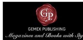
Gemex Publishing, Belgium