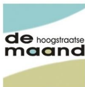
De Hoogstraatse Pers, Belgium