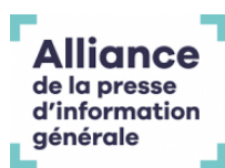
Alliance de la Presse d'Information Générale, France