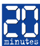
20 Minutes, France